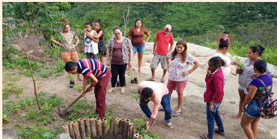
Oficina Farmácia Viva - São Vicente