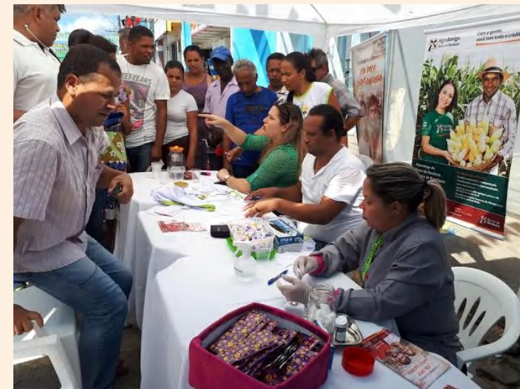
Feira da saúde em Camacã - BA