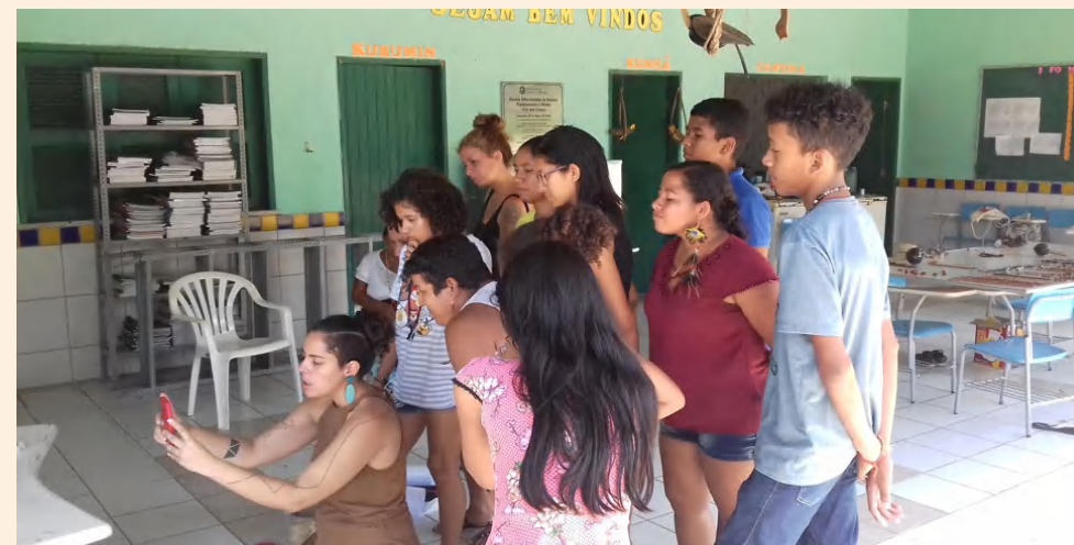
Oficina fotografia - Tapebas