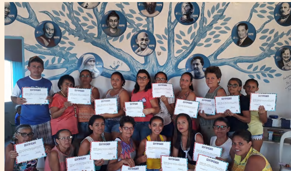
Turma Oficina vagonite - Mundo Novo