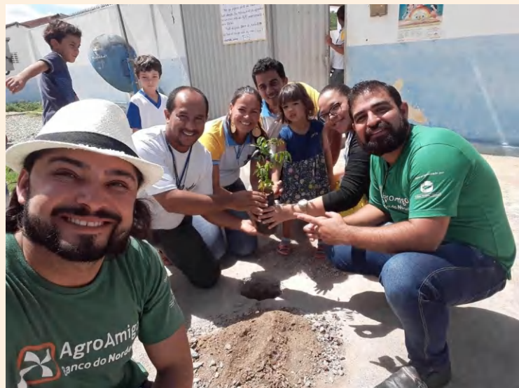
Plantação mudas em Batalha - AL