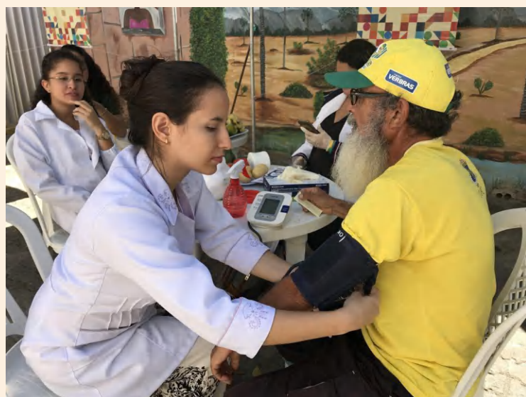
Inec de portas abertas Aferição de pressão