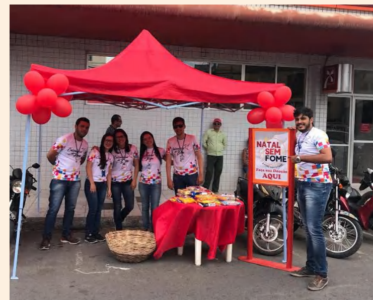
Lançamento Campanha em Bezerros - PE