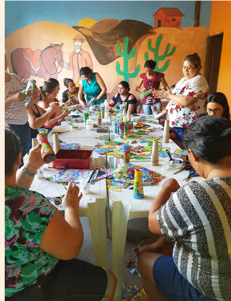
Oficina Brinquedos reciclados