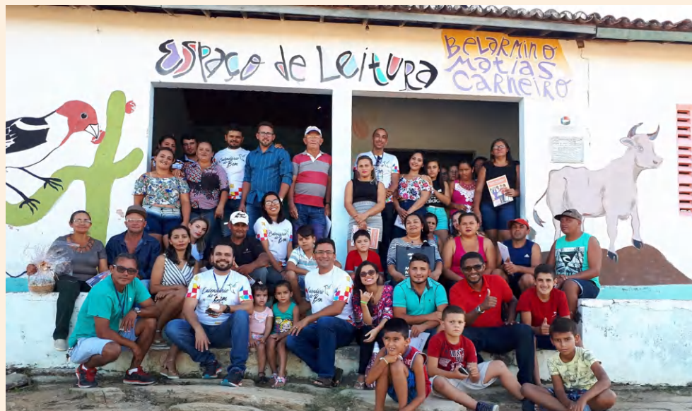
Participantes mutirão - Brasileira