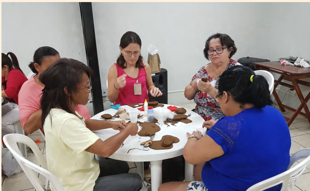
Oficina Bichinhos de feltro